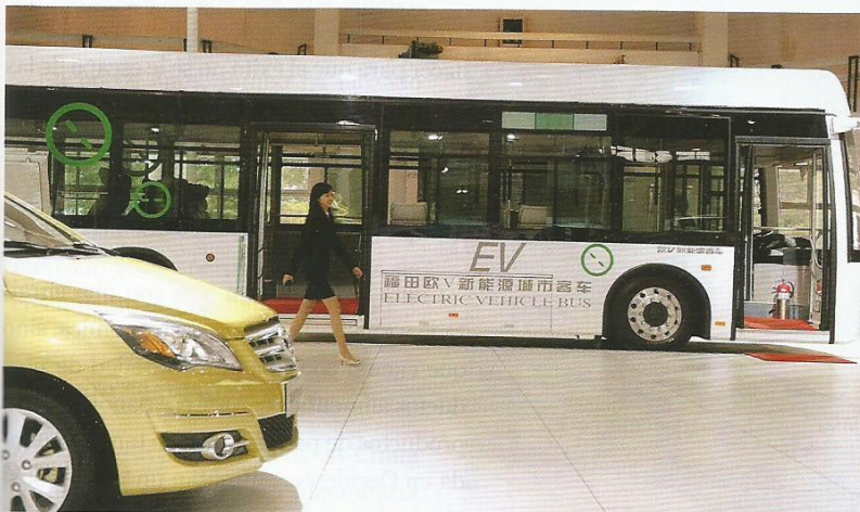
19 de mayo de 2011. Un bus que se mueve gracias a la energía renovable, en la XIV Expo Internacional de Alta Tecnología de Beijing. CFP

Fuente: elaboración propia con base en Mofcom (2010).