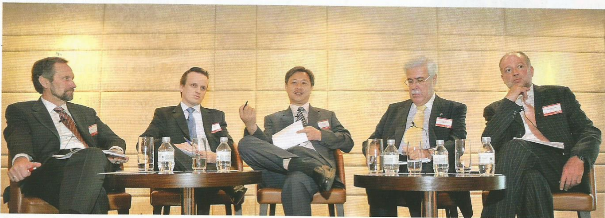
15 de septiembre de 2010. Inauguración en Beijing del II Foro de Inversores China-América Latina.

Las últimas estadísticas oficiales del Ministerio de Comercio (Mofcom) de México reflejan que el comercio exterior de China ha retomado su importante dinamismo en 2010, y después de la crisis global durante 2008-2009, con tasas de crecimiento del 31% y el 39% para sus exportaciones e importaciones, respectivamente. Como resultado, la balanza comercial, positiva, se redujo desde 196.000 millones de dólares en 2009 a 183.000 millones de dólares en 2010. Considerando las presiones internacionales y la aceptación de China de reevaluar su moneda durante 2011, así como el incremento de su consumo, las expectativas para 2011 prevén un aumento de las exportaciones de un 13% a un 15%, de las importaciones de un 15% a un 17% y que el superávit comercial