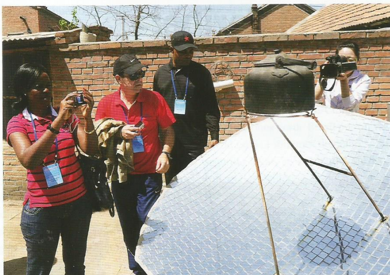
19 de mayo de 2011. 27 periodistas de diez países latinoamericanos visitan la aldea de Sandaoliang del distrito de Luanping, provincia de Hebei.