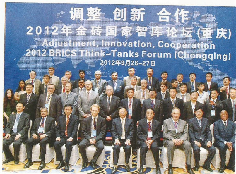
26 de septiembre de 2012. El Foro de Think Tanks de los Países BRICS es inaugurado en Chongqing.

Al mismo tiempo, los intercambios culturales entre ambas partes se vie-